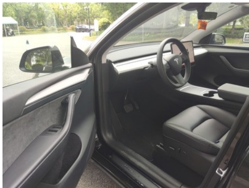
主副驾座椅(前排座椅)