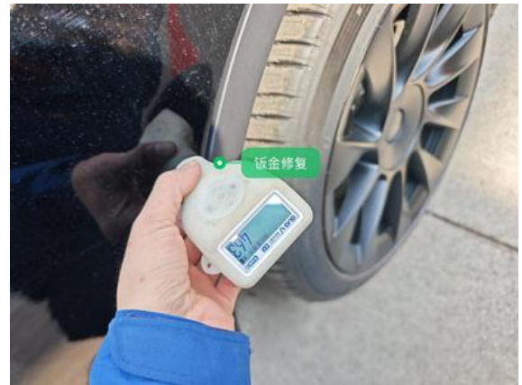
左后车门:钣金修复