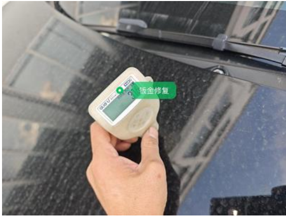
前备箱盖:钣金修复