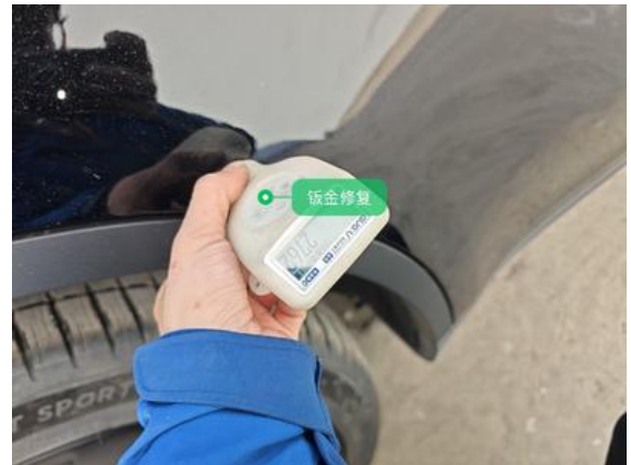
右后车门:钣金修复