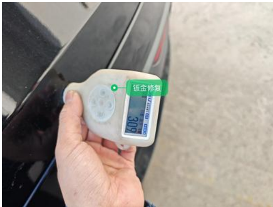
后备箱盖:钣金修复