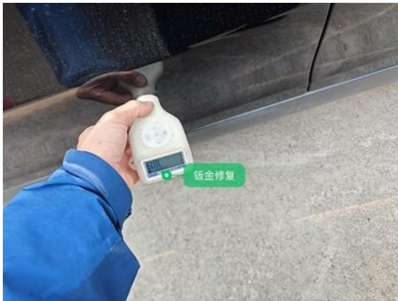
左前车门:钣金修复