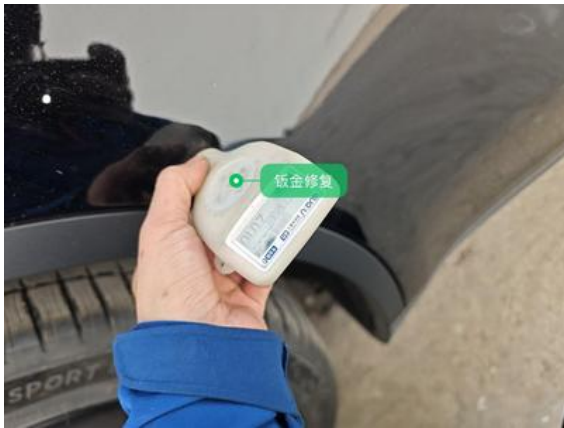
右后车门:钣金修复