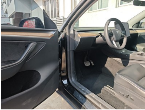
主副驾座椅(前排座椅)